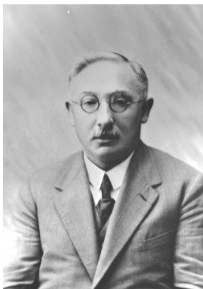
De afscheidsfoto van Louis Hillesum als gevolg van zijn ontslag op 29 november 1940 als rector van het Gymnasium in Deventer.

Een paar maanden na het einde van de Duitse bezetting schreef mejuffrouw Van Nooten een In Memoriam over Hillesum in de schoolkrant van het Stedelijk Gymnasium te Deventer: 'Op Vrijdag 29 November [1940] ontving hij zijn ontslagbrief, waarin hem zijn ambt werd ontnomen 'ter bevordering van de openbare rust en veiligheid'.